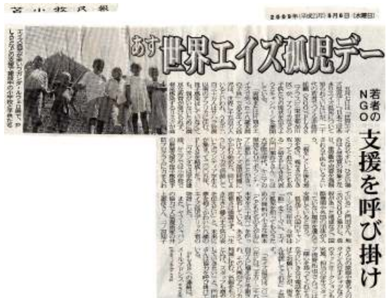
昨年の世界エイズ孤児デーキャンペーンの記事(一部)